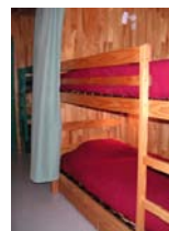
Le coin cabine